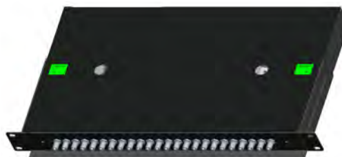
Adaptadores ST (24F)