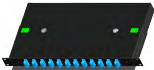
Adaptadores SC duplex