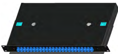
Adaptadores SC (24F)