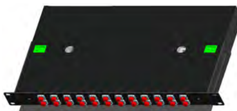
Adaptadores FC (24F)