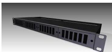
Panel repartidor 1U