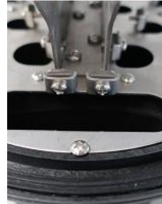
Elementos de fijación de las entradas