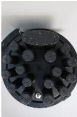
Entradas de cable