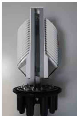
Guia lateral para recogida de tubos del cable