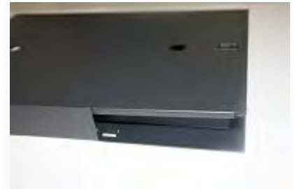
Entrada de cables