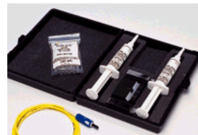
Kit bobinas 23005