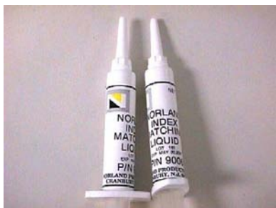
Gel igualador 9006

Herramienta precisa: Peladora de cable y fibra, Cortadora de precisión, , soporte Norland, gel igualador de índice NORLAND